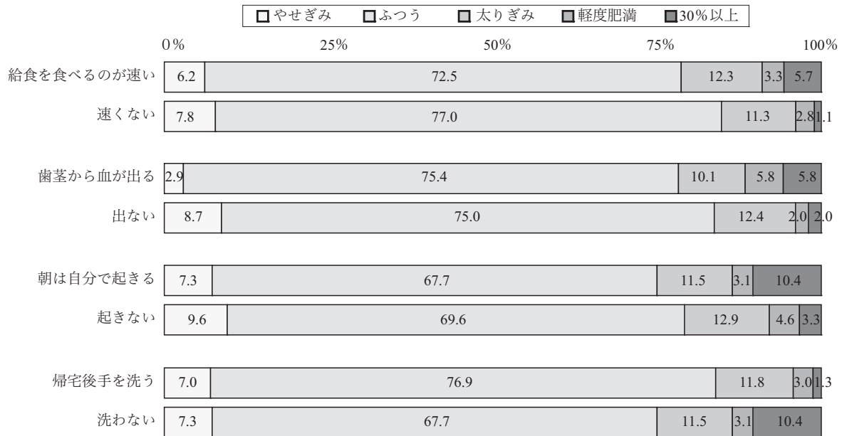
図2 肥満度別生活習慣状況

ロジスティック回帰分析によってみると、家で本を読む者は読まない者と比較してオッズ比2.5倍 ( p=0.002 )、好き嫌いが多い者は多くない者と比較して1.9倍 ( p=0.010 )、食べる時片方の歯だけで噛む者は両側で噛む者と比較して1.8倍 ( p=0.014 ) 肥満児童の出現率が高くなっていた。また、有意な差異は認められなかったが、歯を磨いた後に家族に見てもらう者は見てもらわない者の0.6倍 ( p=0.054 )、朝は自分で起きる者は起きない者の0.6倍 ( p=0.087 )、外から帰ると手を洗う者は洗わない者の0.6倍 ( p=0.071 ) であることなど、肥満に関連する生活習慣要因としてあげられた (表4)。